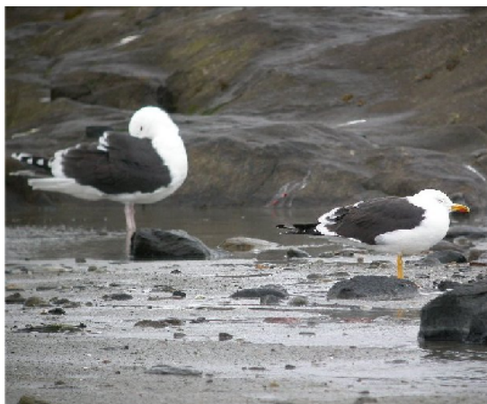
Foto: Nordlig sildemåke foran med svartbak bak. Legg merke til gule bein på sildemåken.

Bestanden av nordlig sildemåke ( Larus fuscus fuscus ) regnes som kritisk. Her i Bodø hekker det noen par på Karlsøyvær og Steinsvær. Gleden var stor når en ny hekkeplass ble funnet i 2008 på Løpsholmen som ligger mellom Skivika og Landegode. Tre par med unger ble registrert