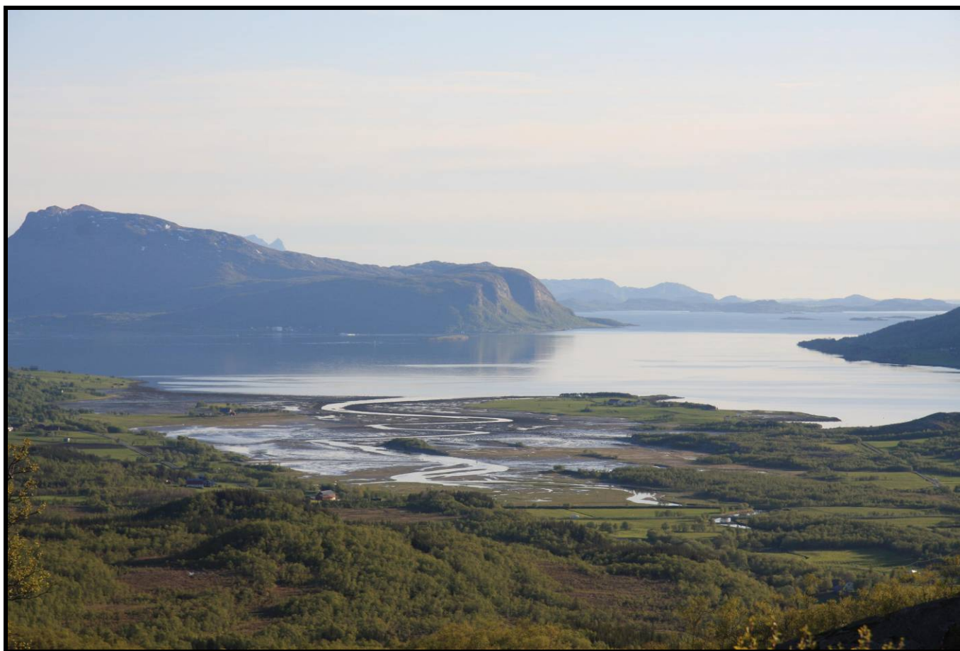
Skogsleira på Nesna med øya Hugla i bakgrunnen.

NOF Nesna og Omegn Lokallag har gleden av å innby dere til NOF Nordland treff 2009 på Nesna. Treffet er helgen 12-14. juni 2009, og starter opp på ettermiddagen etter hvert som det ankommer folk, men første post på programmet blir grilling i Bjørndalen fra 21.00 på fredag kveld, med tilhørende lytting til fuglesang. Området har blant annet en fast bestand av munk, hagesanger og gulsanger, og bøksanger har også vært hørt syngende her. Lørdag blir det utflukt til gode fuglelokaliteter i nærheten med Skogsleira som et hovedmål, se bildet under (silkehegre her i skrivende stund). Årsmøtet blir på ettermiddagen og det er også lagt opp til et par foredrag samt quiz, og på kvelden tar vi en festmiddag i Ninas Lavvo. Vi har flere forslag til turer på Søndagen, men nøyaktige mål bestemmer vi på lørdag alt etter hva det er stemning for! For de som skal med hurtigbåt nordover er det avreise 15:30 på søndag.